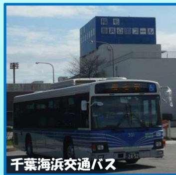
千葉海浜交通バス