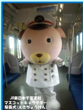
JR東日本千葉支社 マスコットキャラクター 駅長犬(えきちょうけん)